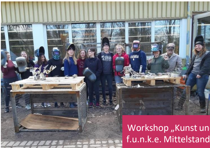
Workshop „Kunst und Schweißen“, f.u.n.k.e. Mittelstands GmbH, 2020

Eine Spendenbescheinigung stellen wir selbstverständlich aus.